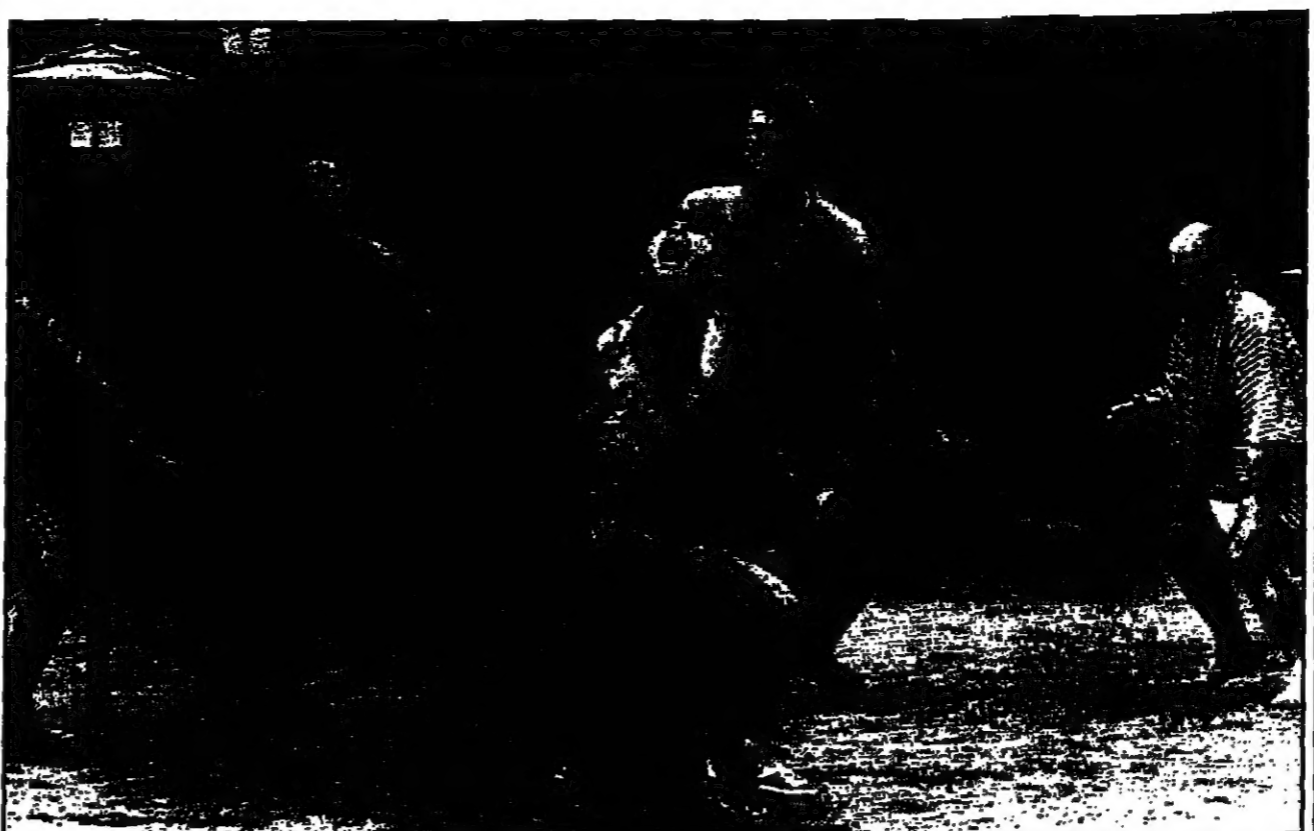
باريس - «القلم العربي» - من شاكرو توري: